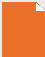
DIN B0 100 X 140 cm