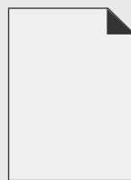
DIN A0 84,1 x 118,9 cm